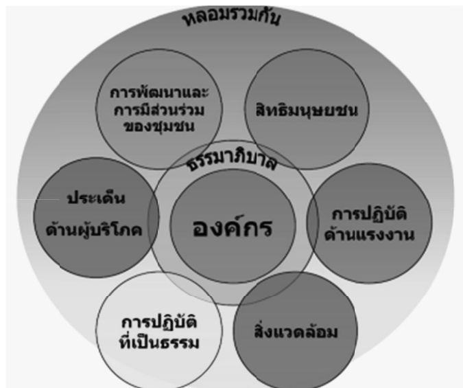
ภาพที่ 1: ความสอดคล้องของ 7 หลักการ ในการเป็นองค์กรธุรกิจที่รับผิดชอบต่อสังคม

เมื่อพิจารณาจากหลักการทั้ง 7 หัวข้อหลักจะพบว่า แนวทางการปฏิบัติของ ISO 26000 จะครอบคลุมความรับผิดชอบต่อทั้ง 3 ด้าน คือ ด้านเศรษฐกิจ ด้านสิ่งแวดล้อม และด้านสังคม ซึ่งสามารถแสดงความสอดคล้องในแต่ละหลักการได้ดังภาพที่ 1