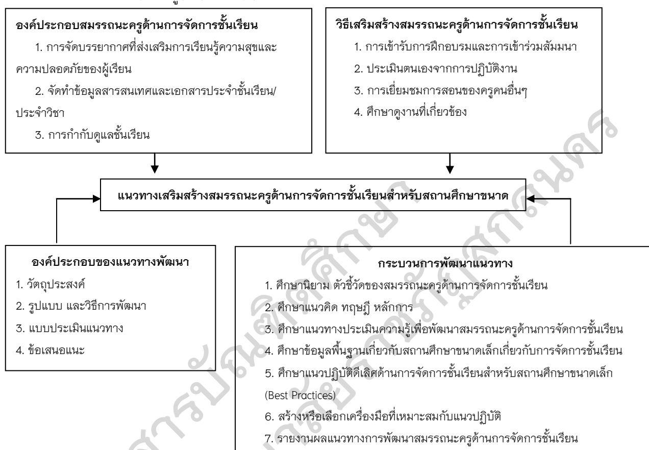
ภาพประกอบ 1 กรอบแนวคิดในการวิจัย