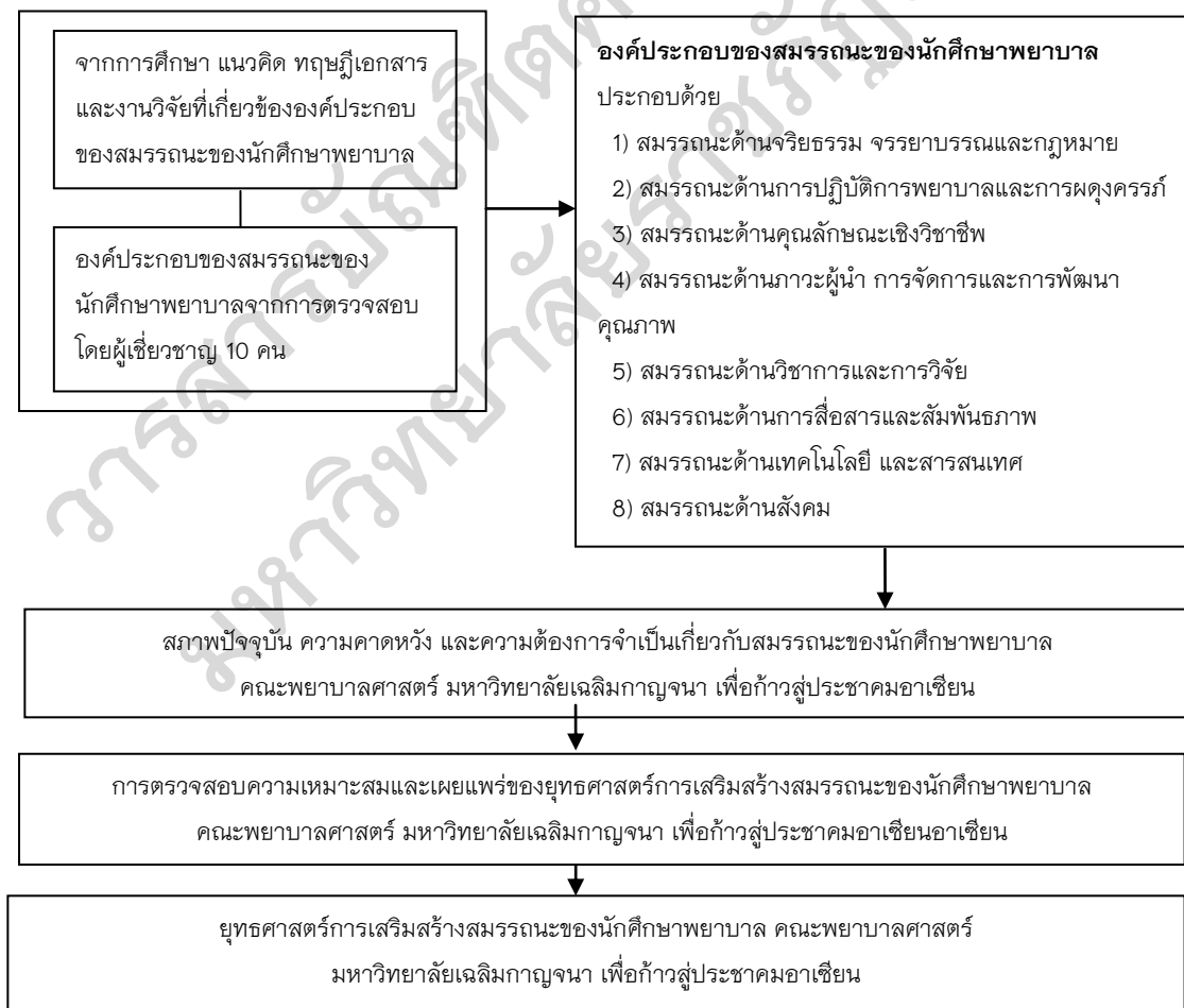
ภาพประกอบ 1 กรอบแนวคิดของการวิจัย

การวิจัยเรื่องยุทธศาสตร์การเสริมสร้างสมรรถนะของนักศึกษาพยาบาลคณะพยาบาลศาสตร์ มหาวิทยาลัยเฉลิมกาญจนา เพื่อก้าวสู่ประชาคมอาเซียน ในการวิจัยครั้งนี้ ผู้วิจัยใช้ระเบียบวิธีการวิจัยและพัฒนา (Research and Development : R&D) โดยมีการดำเนินการวิจัย 4 ระยะ ได้แก่ ระยะที่ 1 วิเคราะห์องค์ประกอบสมรรถนะของนักศึกษาพยาบาล ระยะที่ 2 ศึกษาสภาพปัจจุบัน ความคาดหวังและความต้องการจำเป็น ระยะที่ 3 สร้างยุทธศาสตร์การพัฒนาและ ระยะที่ 4 ตรวจสอบความเหมาะสมและเผยแพร่ยุทธศาสตร์การเสริมสร้างสมรรถนะของนักศึกษาพยาบาลคณะพยาบาลศาสตร์ มหาวิทยาลัยเฉลิมกาญจนา เพื่อก้าวสู่ประชาคมอาเซียน ซึ่งกรอบแนวคิดของการวิจัย ดังภาพประกอบ 1