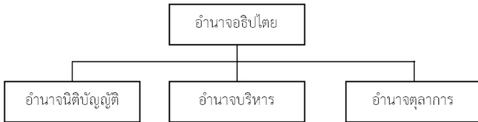
แผนภาพที่ 1 ตัวแบบสถาบัน (ที่มา : Henry, 1995 : 297, cited in Thamrongthanyawong, 2006 : 226)

สำหรับความสัมพันธ์ระหว่างโครงสร้างตามตัวแบบสถาบันสามารถแสดงให้เห็นได้ตาม ของสถาบันทางการเมืองและนโยบายสาธารณะ แผนภาพต่อไปนี้